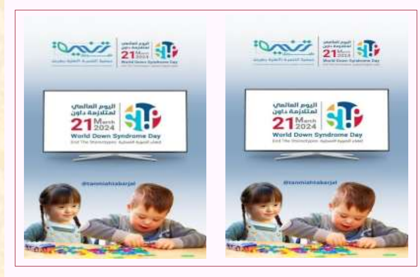
اليوم العالمي لمتلازمة داون ٢٠٢٤ م.