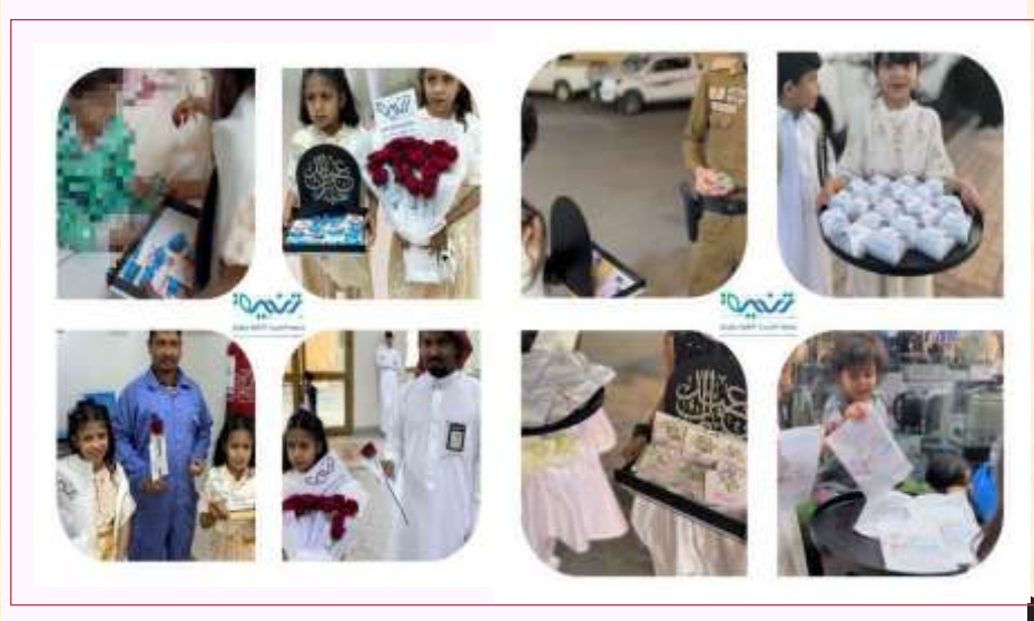
فعاليات برنامج ( من العائدين ) بمناسبة عيد الفطر المبارك لعام ٢٠٢٤ م.