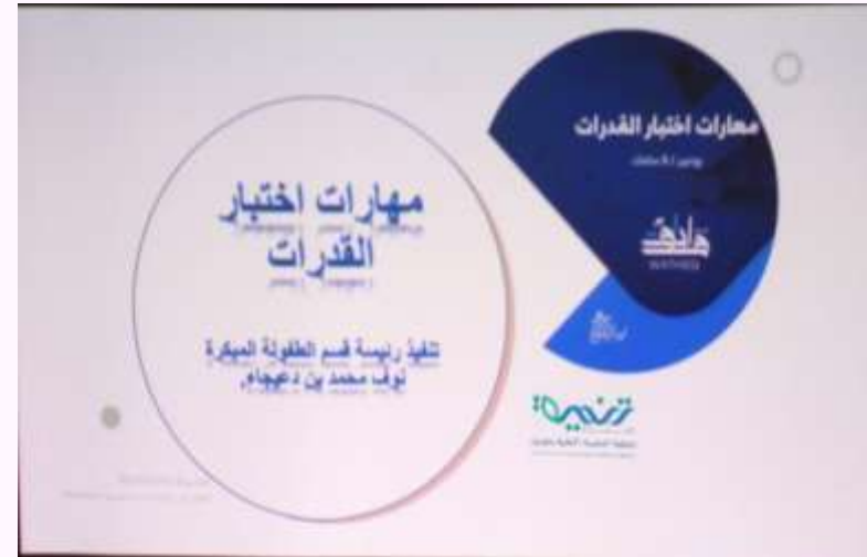
البرنامج التدريبي (مهارات اختبار القدرات القسم اللفظي).