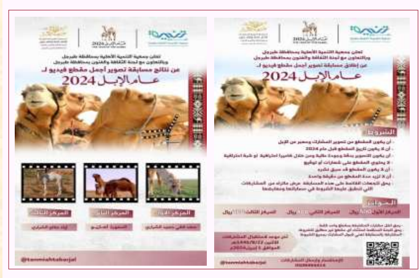
مسابقة تصوير أجمل مقطع فيديو لعام الإبل ٢٠٢٤