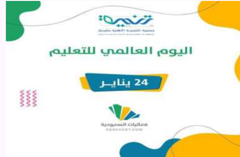
اليوم العالمي للتعليم ٢٤ يناير.