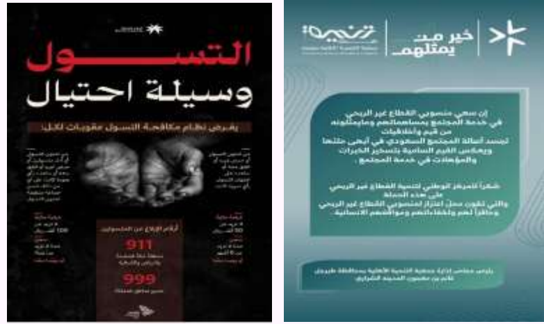
مكافحة التسول ٢٠٢٤ م