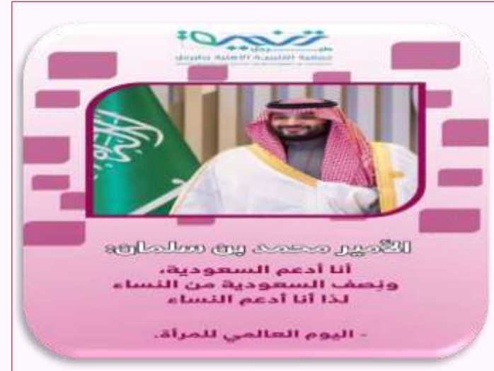
اليوم العالمي للمرأة ٢٠٢٤ م.