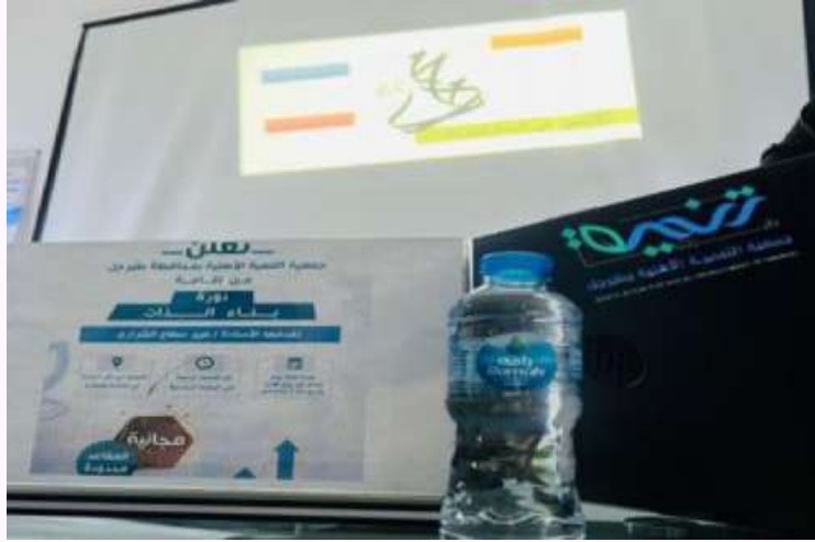
محاضرة بعنوان / بناء الذات يستهدف الفتيات ضمن برنامج مركز النشاط الاجتماعي.