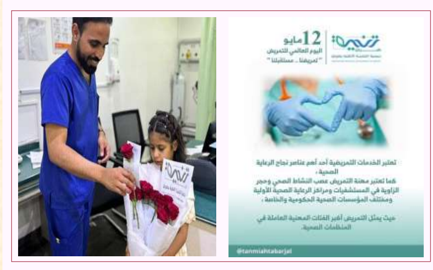
اليوم العالمي للممرضين ٢٠٢٤ م،