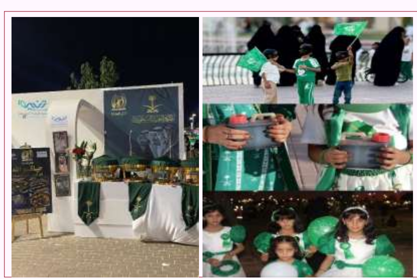
مشاركة الجمعية في تنظيم فعاليات اليوم الوطني السعودي ٩٤ لعام ٢٠٢٤ م.