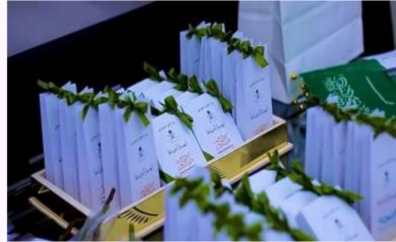
يوم العلم السعودي ٢٠٢٤ م.