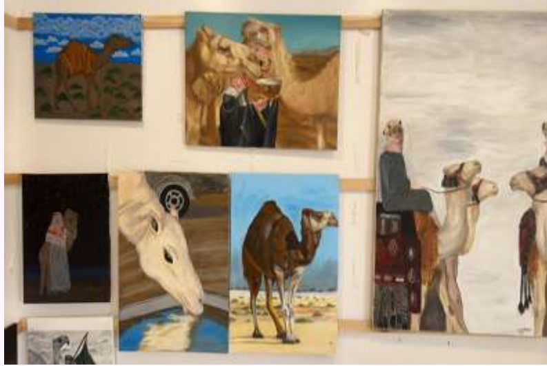
معرض عام الإبل لعام ٢٠٢٤ م.