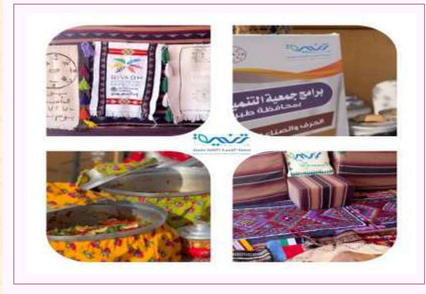
أنشطة وبرامج فعاليات يوم التأسيس ٢٠٢٤ م.