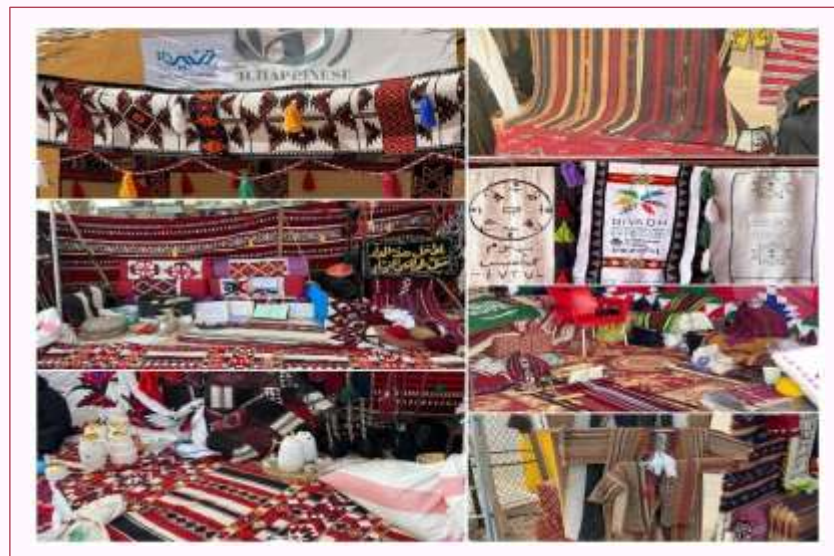
أنشطة ركن الحرفيات ( السدو والنسيج ).