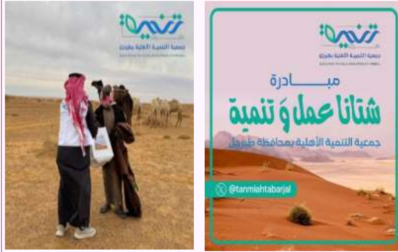
مبادرة شتانا عمل و تنمية