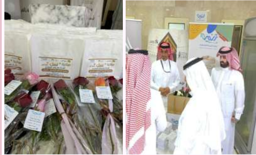
مبادرة نسك لاستقبال ضيوف الرحمن لعام ٢٠٢٤ م.