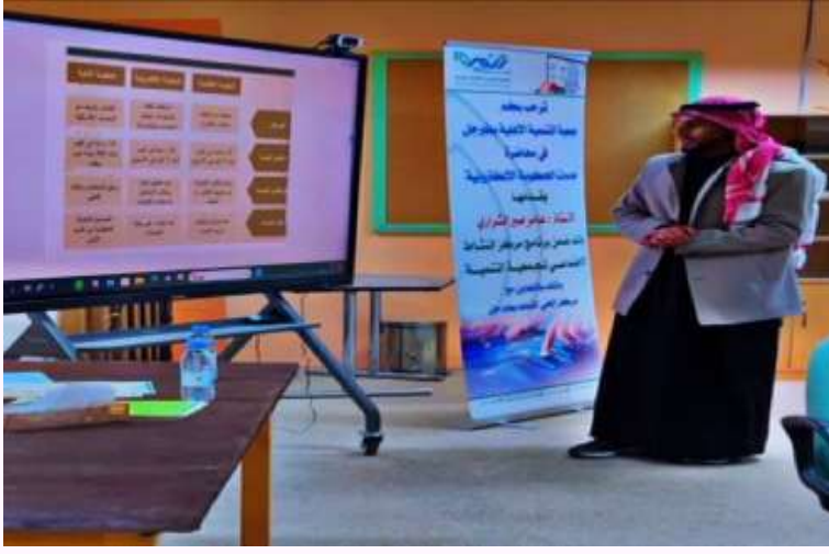
البرنامج التدريبي (خدمات الحكومة الإلكترونية) ضمن برنامج مركز النشاط الاجتماعي بالجمعية