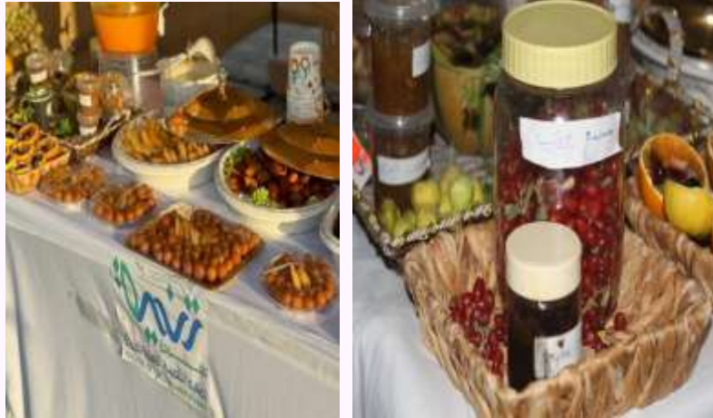
مشاركة الجمعية في تنظيم مهرجان الفاكهة الثالث لعام ٢٠٢٤ م.