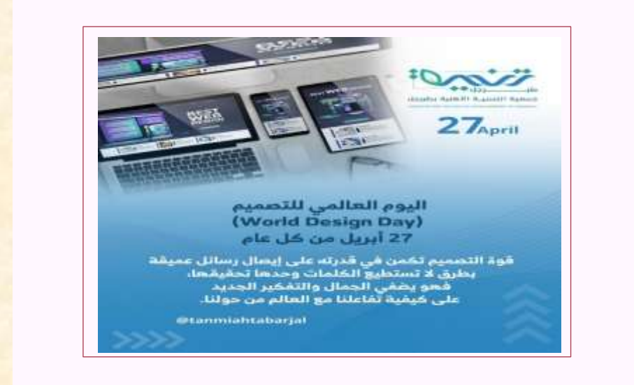
اليوم العالمي للتصميم ٢٧ أبريل ٢٠٢٤ م.