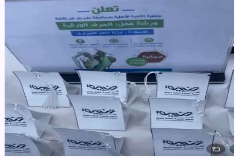
البرنامج التدريبي ( ورشة عمل الحرف الورقية ).