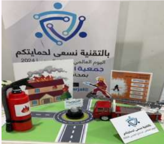
مشاركة اليوم العالمي للدفاع المدني عام ٢٠٢٤ م.