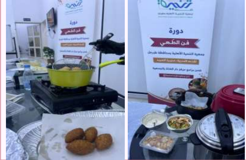
البرنامج التدريبي (فن الطهي).