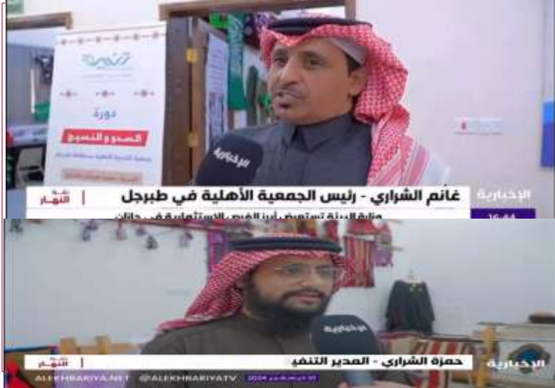
لقاء قناة الإخبارية في زيارته لمقر جمعية التنمية الأهلية بطبرجل