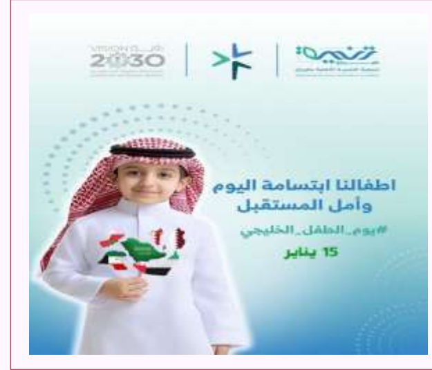
يوم الطفل الخليجي ١٥ يناير.