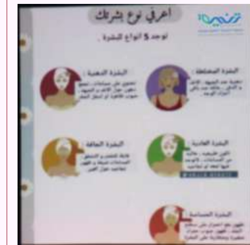
البرنامج التدريبي ( الميك آب وتصنيف الشعر).