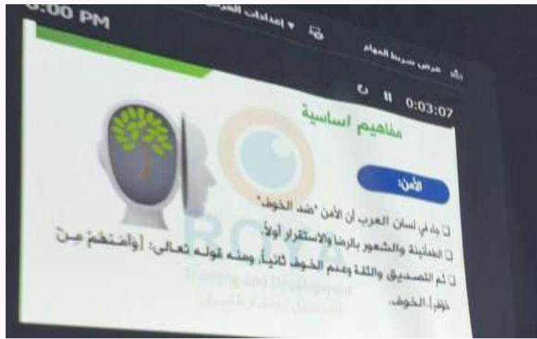
محاضرة بعنوان / الفتاة ودورها في الأمن الفكري